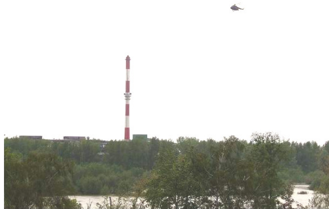
Helikopter pomaga ratować hutę w Sandomierzu

Bank Spółdzielczy Sandomierz 70 9429 0004 2001 0002 1164 0003 z dopiskiem „Powódź”.